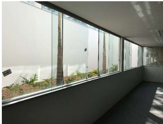
10 – Esquadrias de vidro, 1º subsolo.