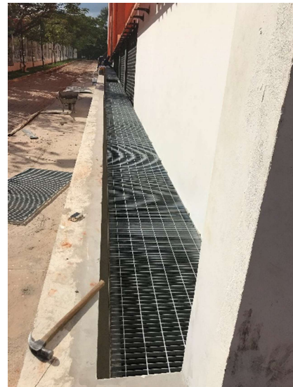
18 – Pannel de azulejo, piso elevado com carpete, luminárias, evaporadoras.