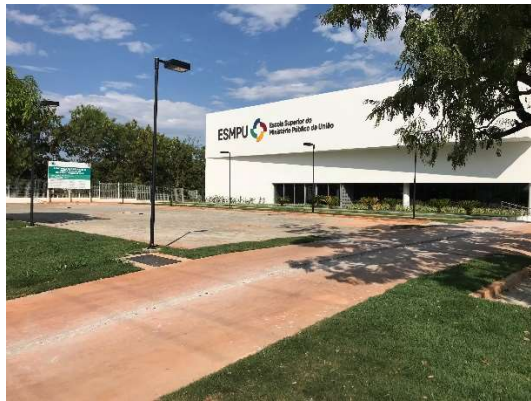
01 – Vista frontal ESMPU, calçamento, estacionamento, postes.