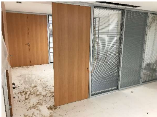
07 – Instalação de divisórias no 1º subsolo.