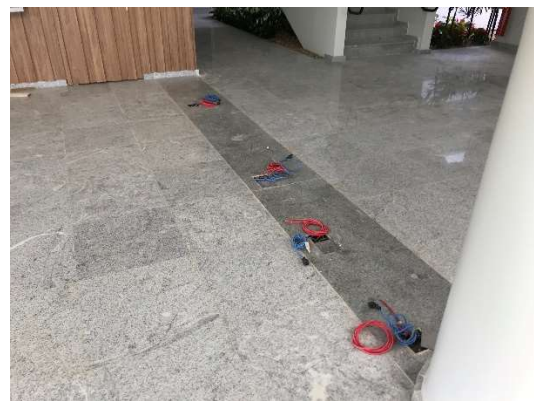
04 – Pontos de rede e energia para catracas.