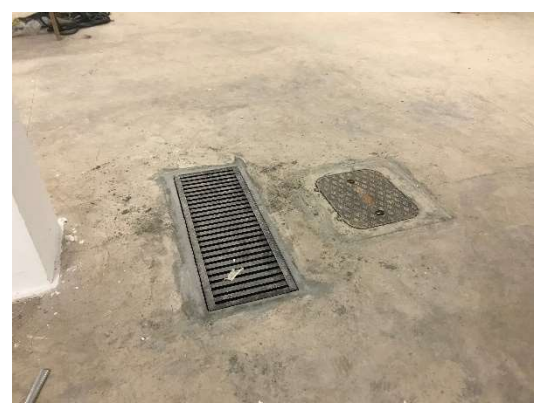
06 – Fechamento de caixas da garagem, esgoto e águas pluviais.