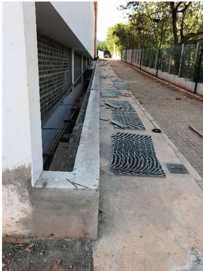
17 – Letreiro da fachada, jardim externo, grade de piso, grama, acabamento de granito .