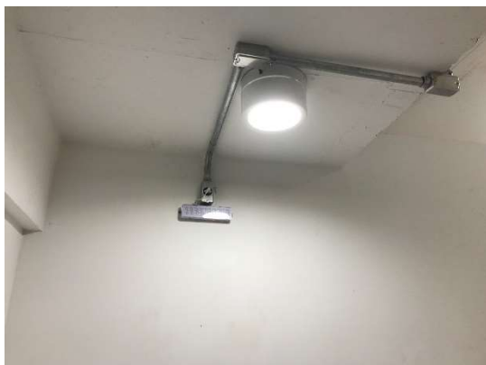
05 – Luminária de escadas, luminária de emergência.