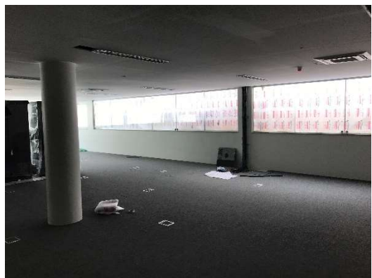
09 – Piso elevado, carpete, forro, instalações de piso, sala TI, 1º subsolo.