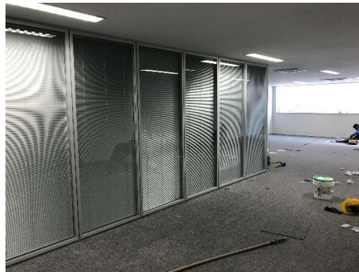
08 – Divisórias de vidro de sala de reuniões 1º subsolo .