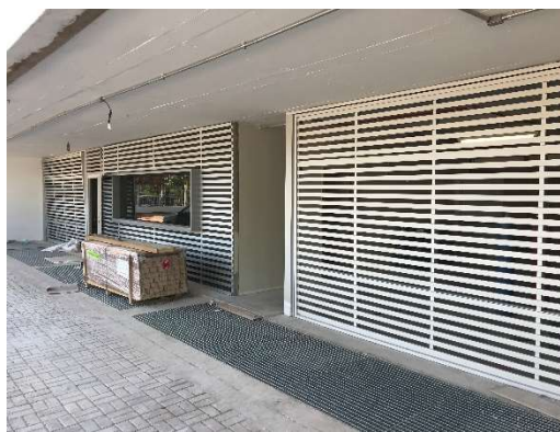
12 – Portões de entrada das garagens.