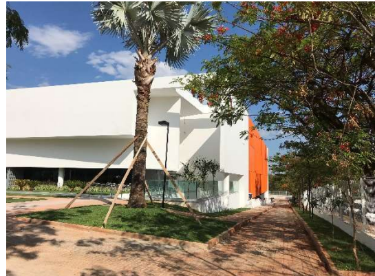
02 – Vista lateral ESMPU, pavimento, jardinagem, meio fio, pintura fachada externa, gradil.