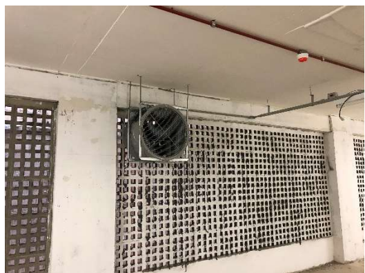
11 – Ventiladores de exaustão 2º subsolo.