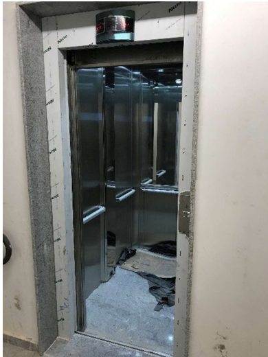
13 – Conclusão instalação dos elevadores.